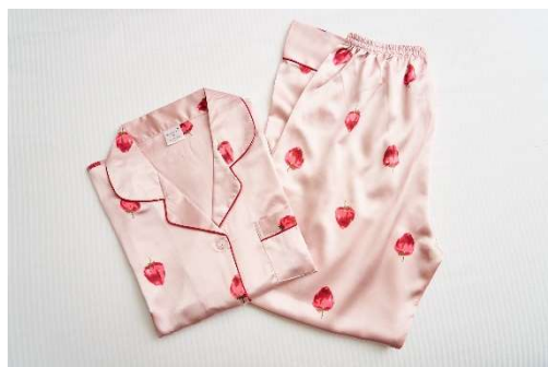
お持ち帰りいただけるいちごのパジャマ サイズはワンサイズのご用意となります。