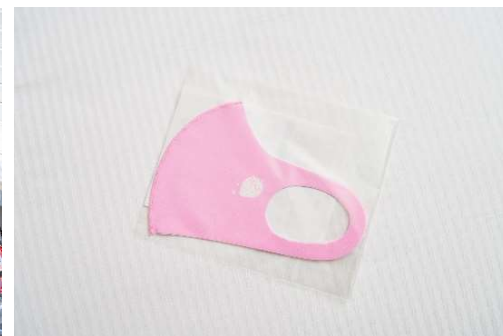
ヒルトン東京お台場オリジナル いちごマスク