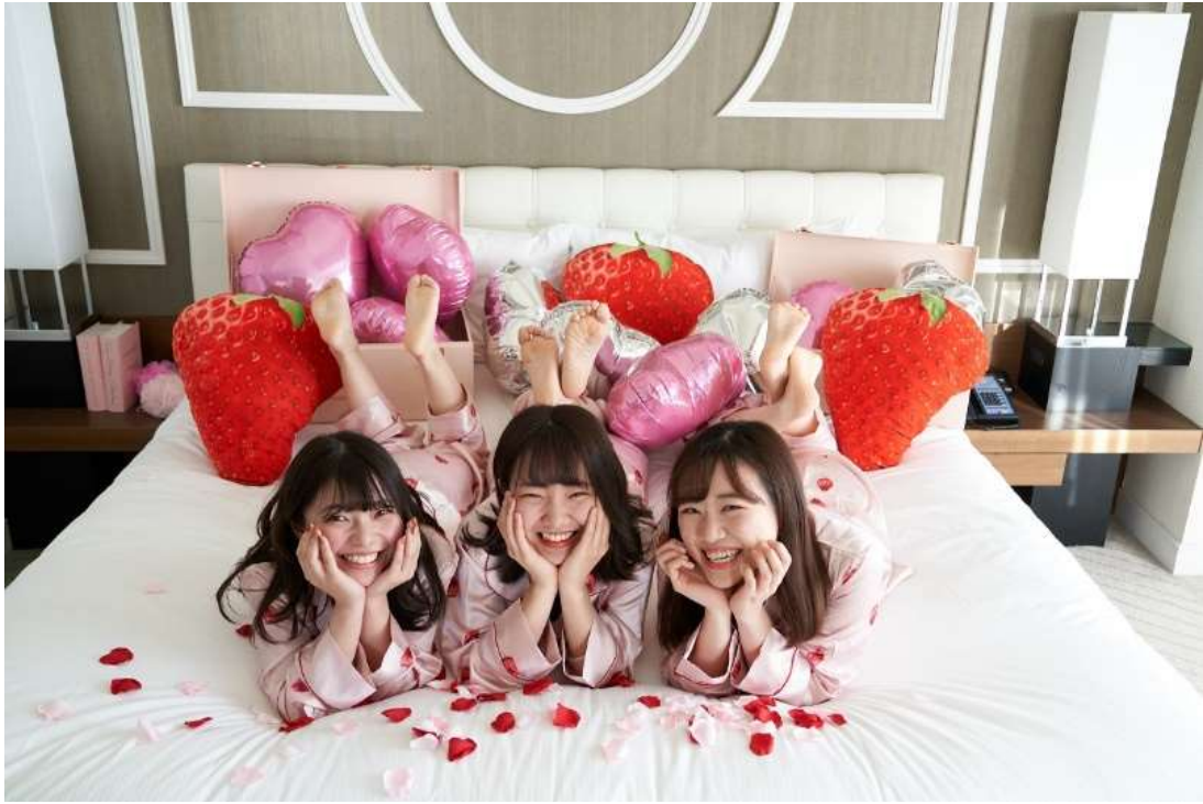
いちごのアフタヌーンティーセットとドリンクをルームサービス