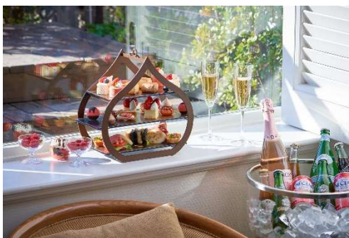
アフタヌーンティーとドリンクをお部屋へ