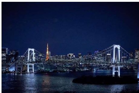
スーペリアデラックスルームから見える レインボーブリッジ(イメージ)