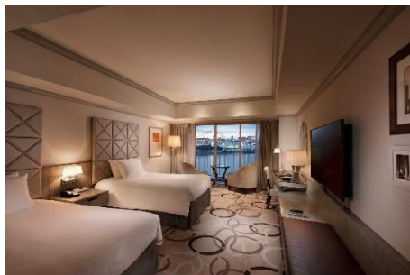
スーペリアデラックスルーム