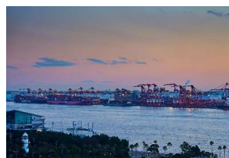
ヒルトンルームから見える 煌めく工場群(イメージ)