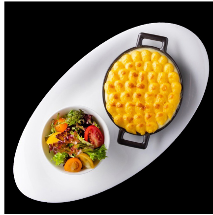
ロンドンプレート