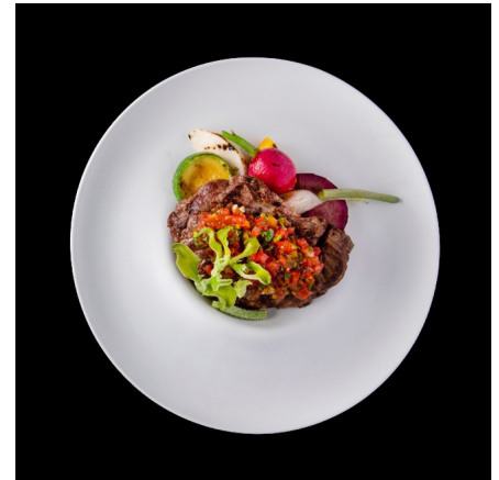
リオデジャネイロプレート