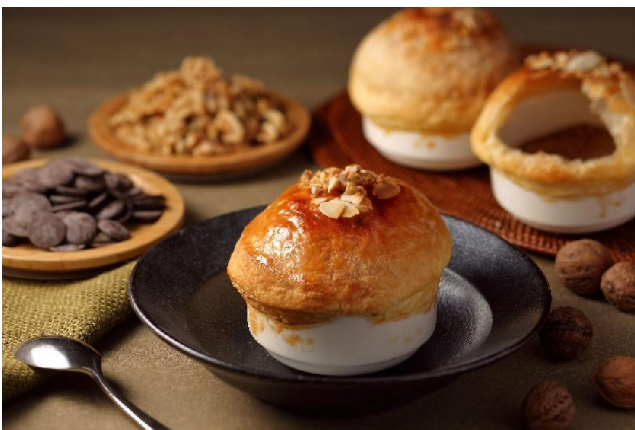
チョコレートブリュレのパイ包み焼きイメージ（ピア）

神戸メリケンパークオリエンタルホテル（所在地：兵庫県神戸市中央区／総支配人：荒木潤一）では、2019年2月1日（金）～2月14日（木）までの期間で、レストラン・バーでバレンタインメニューを提供いたします。