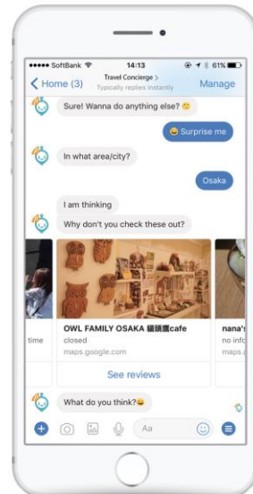
Best local attractions