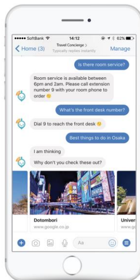
Answer hotel specific questions